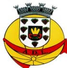
ADL – AD Lousada