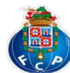
FC Porto – Futebol, SAD – Equipa da Série 1

Nota: não retirar nem trocar as chaves das portas dos cacifos; sem elas, as portas não abrem.